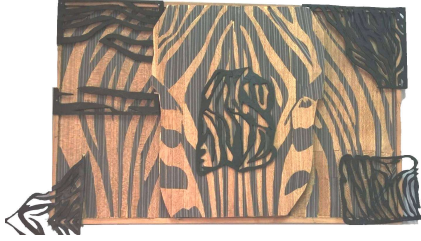
المشغولة الحادية عشر